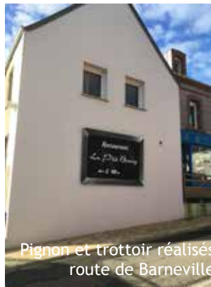
Pignon et trottoir réalisés route de Barneville