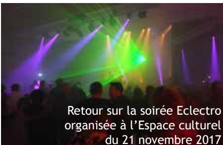
Retour sur la soirée Electro organisée à l'Espace culturel du 21 novembre 2017