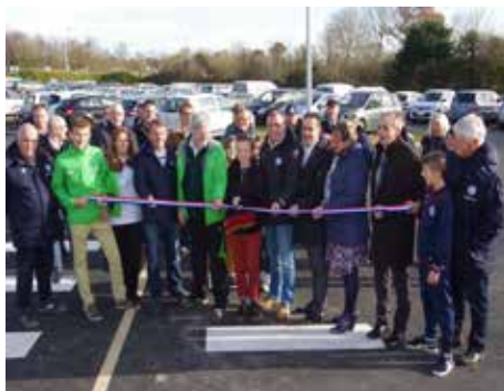
Création d'un parking au stade municipal