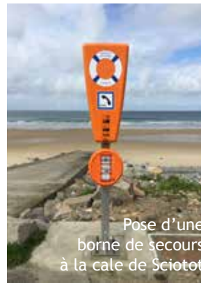
Pose d'une borne de secours à la cale de Sciotot