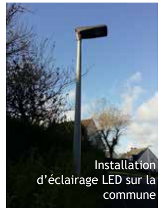
Installation d'éclairage LED sur la commune