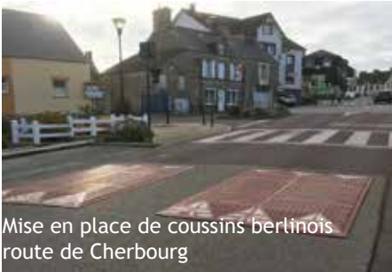
Mise en place de coussins berlinois route de Cherbourg