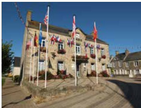
Les PACS sont maintenant en Mairie

Tous droits réservés sur le projet. Modèles déposés à l'INPI. Simulations non contractuelles.