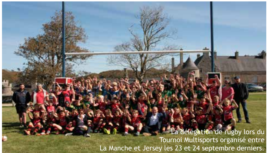
La délégation de rugby lors du Tournoi Multisports organisé entre La Manche et Jersey les 23 et 24 septembre derniers.