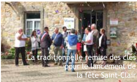
La traditionnelle remise des clés pour le lancement de la fête Saint-Clair