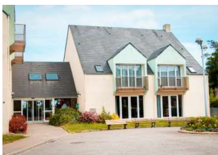
Résidence des Aubépin : le projet de rénovation se poursuit

Sciotot, élue « Plage préférée des Français » !