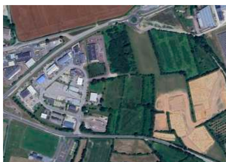
Projet développement économique : aménagement de la Zone des Costils