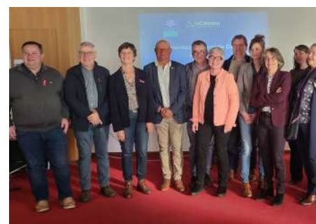
La CAF, un partenaire proche des familles